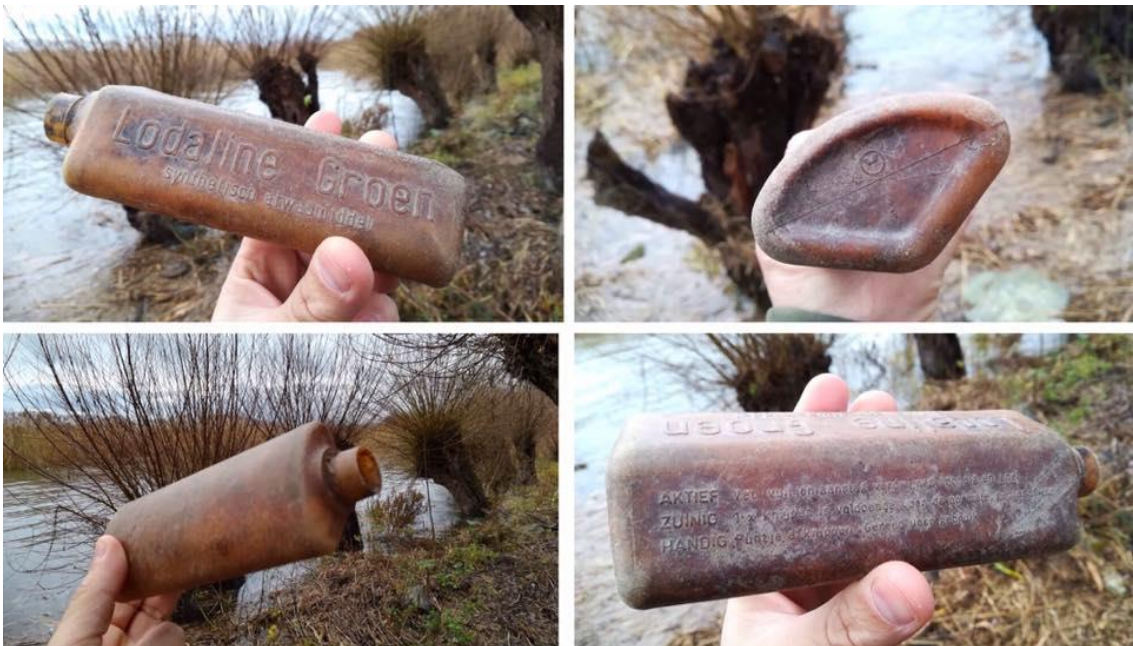
Foto: Deze fles Lodaline is door Zwerfie Rotterdam gevonden in 2019 en is van vóór 1953.

Zwerfie beheert momenteel twee leenkasten met opruimmaterialen in de ruige stadsnatuur op de Spoordijk in Spangen. De materiaalkosten zijn gefinancierd vanuit een bewonersinitiatief, maar het beheer en onderhoud is vrijwilligerswerk. Het gaat nog om een proef die afloopt in november 2023. Daarna zal met de samenwerkingspartners Natuurlijk Spangen, de Groene Connectie en de Roze Brigade worden besloten hoe en of wij hiermee verder gaan. Zwerfie voert dit jaar in de wijk Botu ook een project uit rond clean graffiti met leuzen over zwerfafval. Het voornemen is om vaker op projectbasis eigen voorstellen in te dienen bij overheden en fondsen en die zo mogelijk tot uitvoering te brengen op basis van declarabele uren.