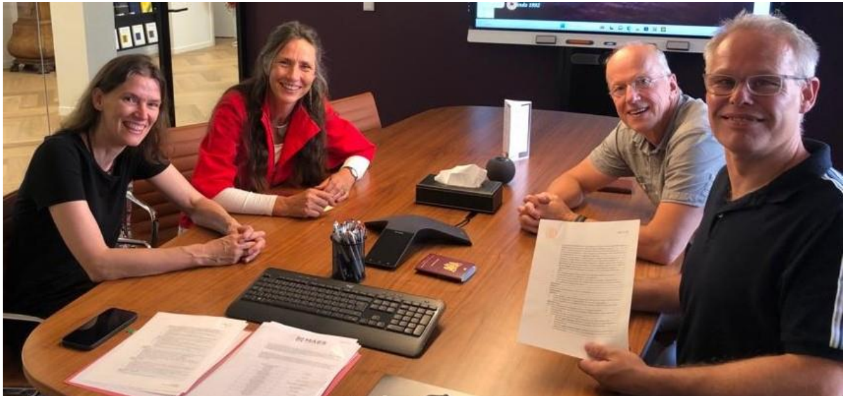
Foto: Oprichting van Stichting Zwerfie Rotterdam bij de notaris.

Het woord Zwerfie is een samentrekking van de woorden selfie en zwerfafval. Een 'zwerfie' is dus letterlijk een foto van een opgeraapt stuk zwerfafval, maar het woord wordt ook breder gebruikt voor het opgeraapte item zelf. Het begrip zwerfie staat sinds enige jaren in de Van Dale. Zwerfie Rotterdam heeft bewust gekozen voor de naam, omdat laten zien wat je opruimt door het maken én delen van een #zwerfie via sociale media afzenders bewust maakt van de negatieve impact van hun verpakkingen en zorgt voor publieke druk. Het zichtbaar opruimen van zwerfafval geeft bovendien recht van spreken om van afzenders te verlangen de hoeveelheid te beperken. Dat kan door overbodige verpakkingen te schrappen en door het verduurzamen van verpakkingsmaterialen, zodat de ecologische schade minder groot is als het in de natuur terecht komt. Maar ook door retoursystemen, levensduurverlenging en door recycling.