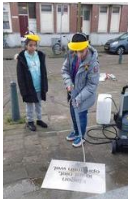
Foto: Clean graffiti in Bospolder.