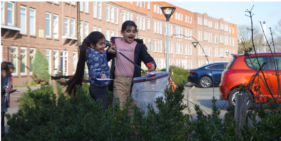
Foto: Leerlingen ruimen zwerfafval op in Spangen en spelen Zwerfie-bingo.

Zwerfafval is een spiegel van de maatschappij. Zo zagen wij al vroeg dat lachgas aan een opmars bezig was en hebben we verslavingsdeskundigen daarop kunnen wijzen. Maar denk ook aan vondsten die van belang kunnen zijn bij politieonderzoek, het ontdekken van nieuwe merken flesjes en blikjes die onwettig geen statiegeldlogo dragen of het waarnemen van opvallende veranderingen in aangespoelde items op rivieroeveren. Zo was de vondst van sponsballetjes aanleiding voor de milieudienst om onderzoek te doen naar de herkomst en heeft een locatie met opvallend veel pur ertoe geleid dat een nabijgelegen bedrijf het kavel hermetisch heeft afgesloten door inzet van Zwerfie Rotterdam.