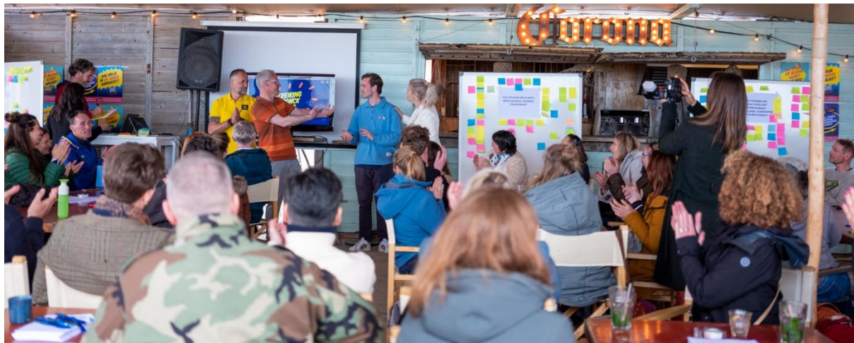
Foto: Bekendmaking winnaar Spronck-prijs tijdens de Plastic Avengers-conferentie. Zwerfie is tweede.

te kunnen vinden en als nodig op afstand samen te kunnen werken op dossiers. Om die reden zijn wij betrokken bij een landelijke netwerkborrel van plastic activisten en wisselen wij data en kennis uit met andere zwerfafvalgroepen.