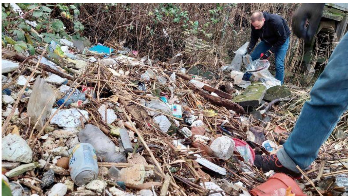
Foto: Opruimactie met vrijwilligers in de Keilehaven.

Opruimacties vinden bij voorkeur plaats op plekken met ecologische impact. Denk aan waterkanten, kades en stadsnatuur. Opruimacties worden gehouden met vrijwilligers en gefaciliteerd door de coördinator die zorgt voor voldoende materialen, indien nodig voor een drankje en koek ter plekke, afvoer van afval en voor andere benodigdheden, zoals bijvoorbeeld desinfectie. Daarnaast is het mogelijk om een opruimactie te laten begeleiden door onze coördinator in de rol van zwerfafvalgids, die hiertoe gemachtigd is om afspraken te maken met bijvoorbeeld bedrijven of organisatoren van evenementen of samenwerkingspartners zoals de Fietsersbond.