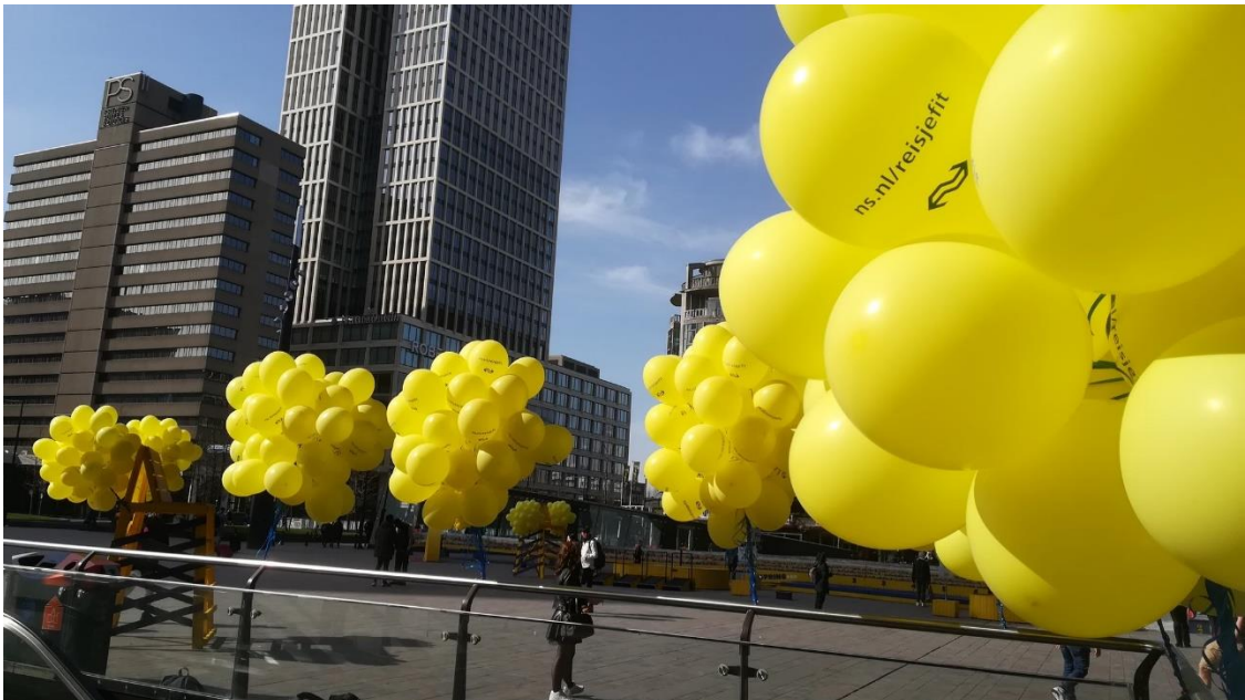
Foto: Door lobby van Zwerfie Rotterdam is het oplaten van ballonnen vanaf 2020 niet meer toegestaan.

Zwerfie geeft gevraagd en ongevraagd advies over zwerfafvalgerelateerde kwesties, met name aan ambtenaren en raadsleden. Dat kan gaan over nieuwe beleidsdocumenten, het delen van kennis in gesprekken met ambtenaren, het aankarten van verbeterpunten in de uitvoering of communicatie van de gemeente, het aanleveren van deelnemers voor bijvoorbeeld 'Bakkie voor een Zakkie' of bijvoorbeeld om het identificeren van ontwikkelingsopties voor de app MeldR. Denk daarnaast aan advies en ondersteuning aan nieuwe opruimgroepen in Rotterdam en daarbuiten of aan het geven van lezingen, speeches of deelname aan buitenactiviteiten van derden, bijvoorbeeld door middel van zwerfie-bingo. Het geven van ongevraagd gratis advies leidt regelmatig tot positieve ontwikkelingen die wij niet zouden hebben bereikt als adviezen alleen kunnen worden gegeven indien daar projectgeld tegenover moet staan.