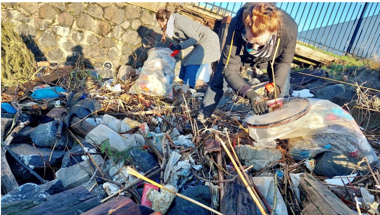
Foto: Opruimactie met vrijwilligers van Zwerfie Rotterdam aan de Lekhaven.

Hieronder staan activiteiten waarvoor wij geen factuur kunnen versturen en die zich niet laten vangen in een afgebakende projectaanvraag. Ze zijn niet kansrijk om voor een projectsubsidie in aanmerking te komen en de activiteiten hebben veelal een permanent karakter. Voor deze activiteiten wil het bestuur een basissubsidie realiseren.